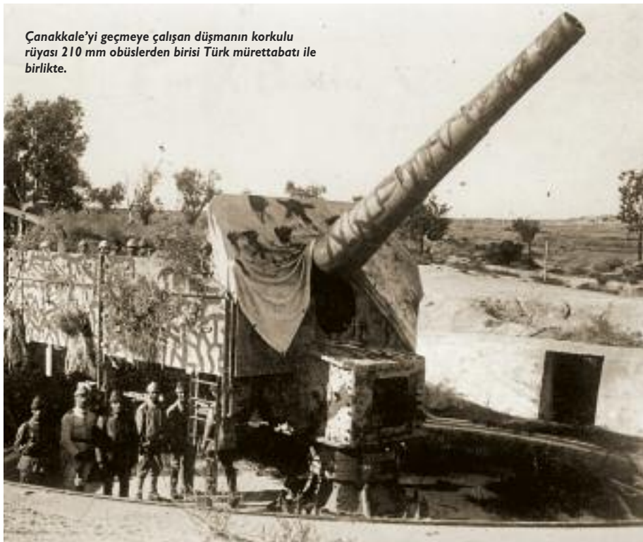
Çanakkale'yi geçmeye çalışan düşmanın korkulu rüyası 210 mm obüslerden birisi Türk mürettebatı ile birlikte.

Goeben [Yavuz] ve Breslau [Midilli] savaş gemilerinin Rus limanlarına saldırmasıyla bu amacına ulaşmasını da bildi. Yalnız şu da tarihi bir gerçektir ki, Osmanlı Donanması'nın 29 Ekim 1914 sabahı Karadeniz'deki Rus limanlarından Sivastopol, Odesa, Kefe ve Novorossisk yanında Rus Donanması'na karşı gerçekleştirilen saldırı emri doğrudan Berlin'den verilmiştir. Bu emri Amiral SOUCHON aynen uygulamış ve saldırılar başta Midilli ve Yavuz zırhlılarında olmak üzere Osmanlı deniz unsurlarında bulunan Alman bahriyelileri tarafından denetlenmiştir. Zaten Enver Paşa, ne kadar çok isterse istesin, Osmanlı'yı