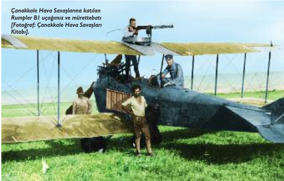
Çanakkale Hava Savaşlarına katılan Rumpler B1 uçagımız ve mürettebatı.

S&H: Alman İmparatorluğu'nun, Osmanlı Devleti ve Güney Cephesi ile ilgili askeri vizyonu neydi? Böyle bir askeri ittifak söz konusu olduğuna göre, Türk ve Alman taraflarının ortak çıkarları çok yüksek olmuş olsa gerek?