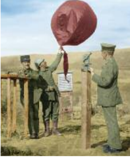
Çanakkale'de kurulan meteoroloji istasyonunun personeli hava tahmin balonunu hazırlarken görülüyor.

Alman bahriyelisinin ölümü ile sonuçlanan bir askeri faciadan ötürü, ceza olarak İstanbul'a sürülen Deniz Albayı Waldemar PIEPER getirildi. Albay PIEPER Osmanlı ordusunda Tümamiral rütbesini alarak Silah Dairesi ve Fabrikaları komutanı oldu. PIEPER'in plan ve koordine çabalarıyla silah ve mühimmat imalathaneleri kuruldu. Bu imalathanelerde top ve top mühimmatına kadar birçok başarılı üretimler sonucunda PIEPER'in suçu 8 Aralık 1915 tarihinde bizzat Alman İmparatoru II. WILHELM tarafından affedilmekle kalmadı, PIEPER bu başarılarından dolayı resmen onurlandırıldı.