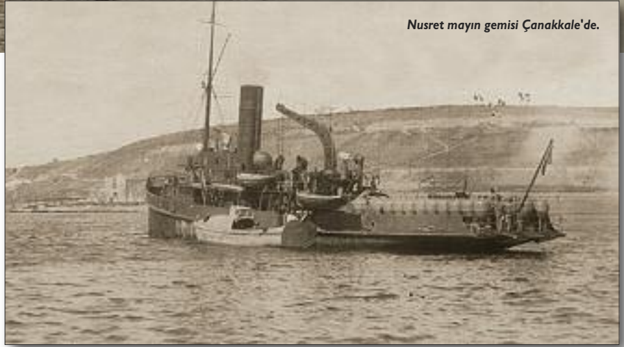
Nusret mayın gemisi Çanakkale'de.

K. WOLF: Türkiye'de bulunduğum dönemde Türk meslektaşlarımdan Çanakkale Savaşı hakkında çok şey duydum ve öğrendim. Bu muharebelere Türklerle birlikte Alman askerlerinin de katılmış olduğunun somut boyutunun farkına daha net bir şekilde vardım. Benim de iştirak ettiğim bir Çanakkale Zaferini anma töreninde, bir Türk delegasyonu tarafından Tarabya sirtlarındaki Alman Askeri Mezarlığı'nda bulunan Osmanlı 5nci Ordu Komutanı