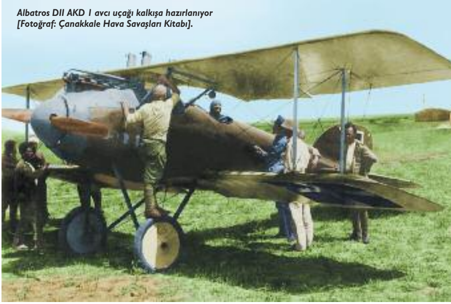
Albatros DII AKD I avcı uçağı kalkışa hazırlanıyor.

revleri icra etmiş, daha sonraları bu öncel göreve ilave olarak İtilaf güçlerine ait havaalanları ve gemilerine karşı çok başarılı bombardıman uçuşları da gerçekleştirdi.