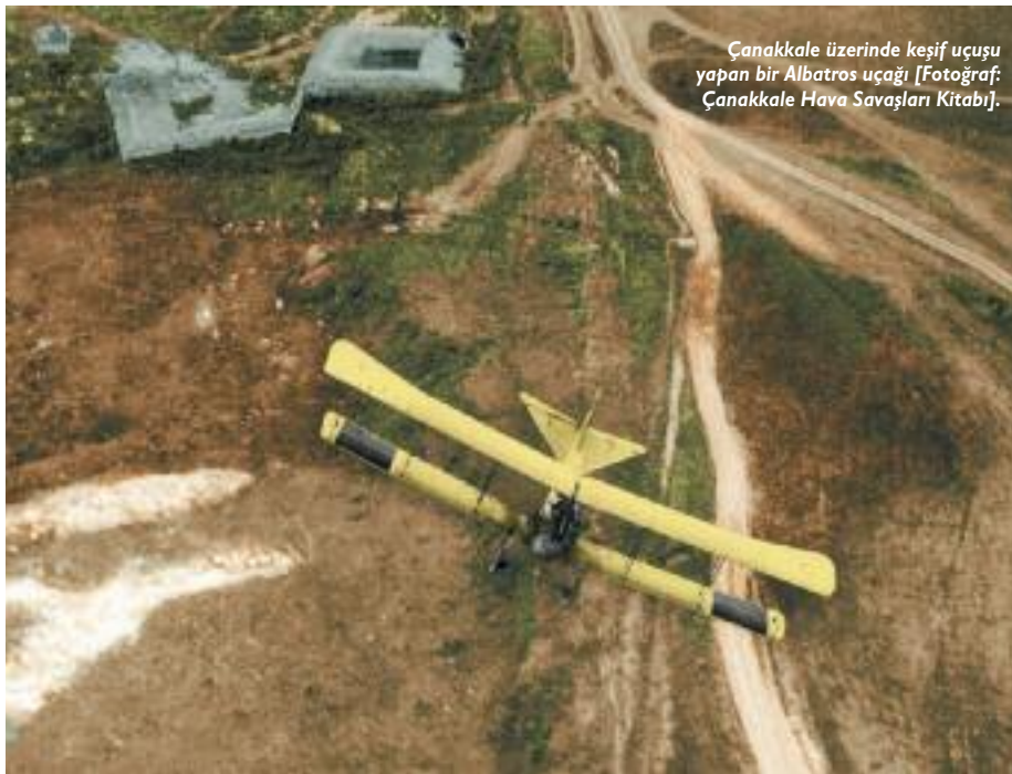
Çanakkale üzerinde keşif uçuşu yapan bir Albatros uçağı.

ESAT BÜLKAT]. ESAT Paşa ve Mustafa KEMAL'in birlikte hazırladığı Gelibolu yarımadası savunma planının Mareşal Liman von SANDERS tarafından değiştirilmemesi halinde Türk ordusunun daha başarılı olup olamayacağı da bugün dahi tartışılan bir husustur.