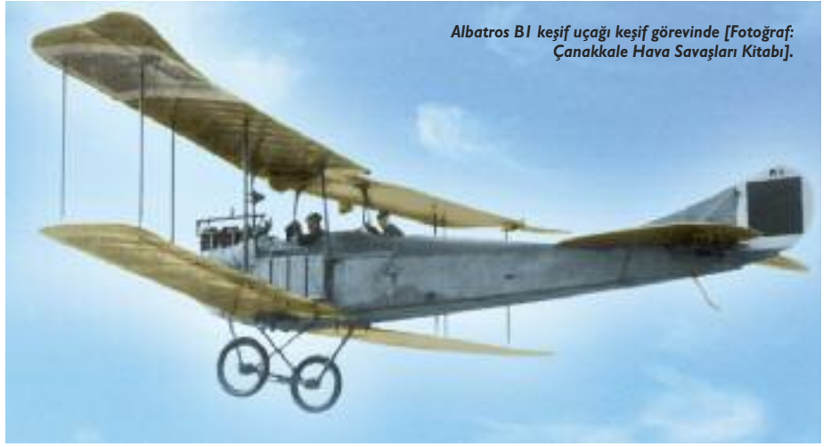
Albatros B1 keşif uçağı keşif görevinde.

Gelibolu çıkarması sırasında yarbay rütbesindeki Mustafa KEMAL, 19ncu Tümen komutanıydı ve çok önemli bir fonksiyonu vardı. Fakat 5nci Ordu'nun komutasını Mareşal Liman von SANDERS devralıncaya kadar stratejik komuta 3ncü Kolordu ve Arıburnu Kuzey Grubu Komutanı ESAT Paşa'daydı [Mehmet