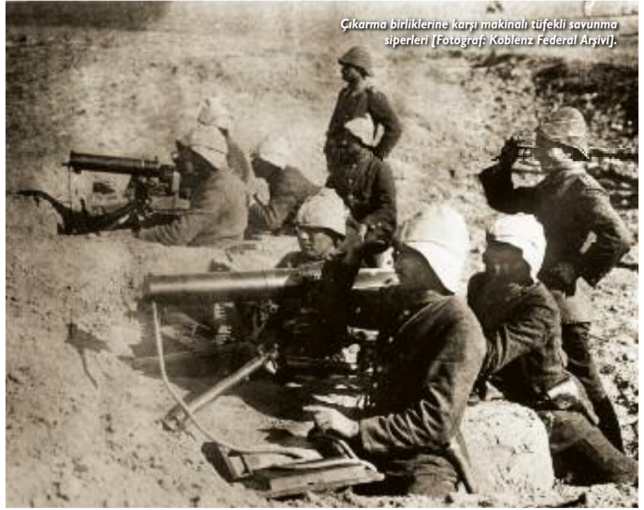
Çıkarma birliklerine karşı makineli tüfekli savunma siperleri.

Kanımca bugüne dek tarihin bu ünitesi yeterince irdelenmemiştir ve özellikle Al-