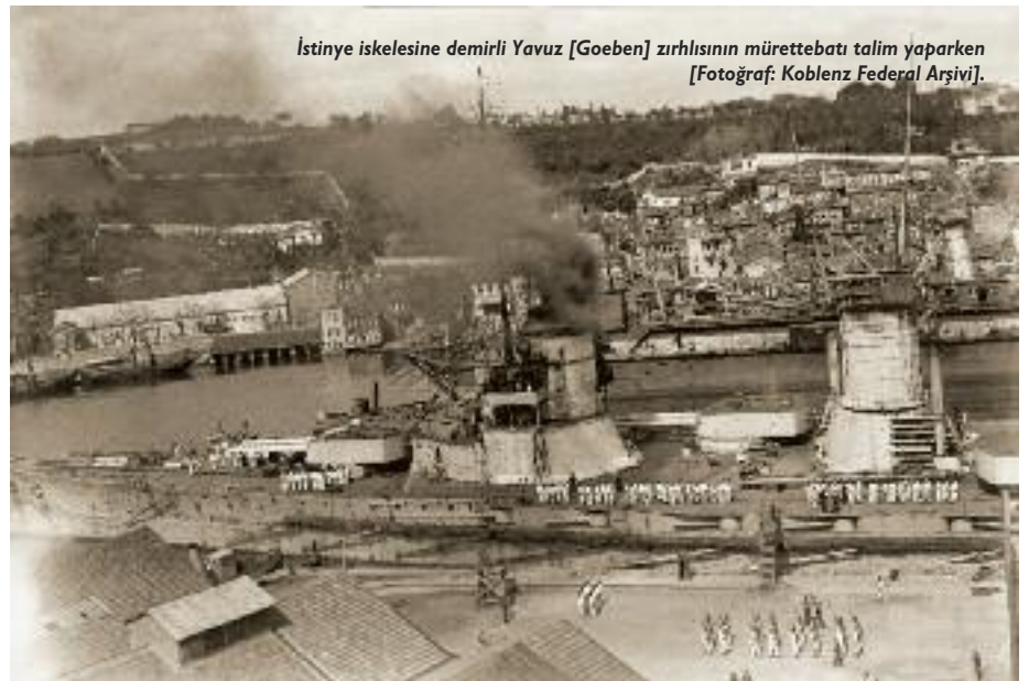
İstinye iskelesine demirli Yavuz [Goeben] zırhlısının mürettebatı talim yaparken.

Bence ikili tarafların bir anlaşmazlık veya çatışma sonrası - ki bunlar sosyal gruplar olabilir veya iki halk topluluğu olur hiç fark etmez - geçmişte cereyan eden hadiselerle ilgili birbirleri ile açıkça görüşmeleri gerekiyor. Bunu yaparken de gerginliği gündemde tutmaktan başka hiç bir işe yaramayan karşılıklı suçlamalardan kaçınmaya özellikle dikkat etmenin, fakat suç ve yanlışları da samimiyetle itiraf ederek eski yaraların sarılmasını sağlamaya özen gösterilmesinin gerektiği kana-